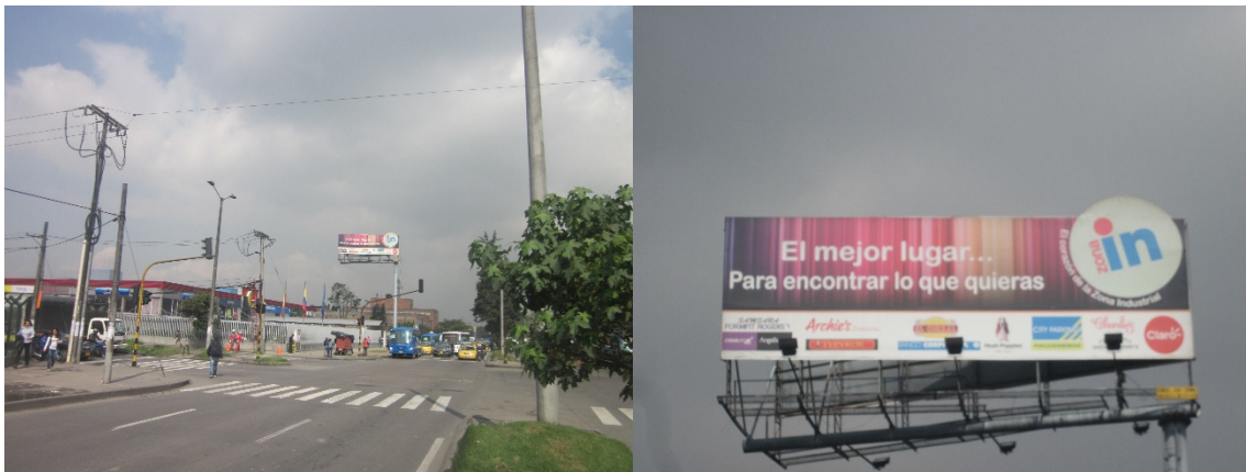
VISTA PANORÁMICA DEL ELEMENTO DE PUBLICIDAD EXTERIOR VISUAL TIPO VALLA TUBULAR COMERCIAL INSTALADO – SENTIDO ESTE – OESTE: ZONA IN

6. VALORACIÓN TÉCNICA: Revisado el informe de Diseño Estructural y Análisis de Estabilidad, presentado por el Ingeniero Calculista, se evidencia el contenido de la memoria de diseño y cálculo, así como la descripción del procedimiento por medio del cual se realizó el diseño de la estructura de Cimentación y el análisis de estabilidad respectivo; (Norma Colombiana Sismo-Resistente NSR-98). Así mismo, de los resultados obtenidos del Análisis de Estabilidad se evidencia que el Factor de Seguridad al volcamiento originado por cargas de Viento o sismo, cumplen.